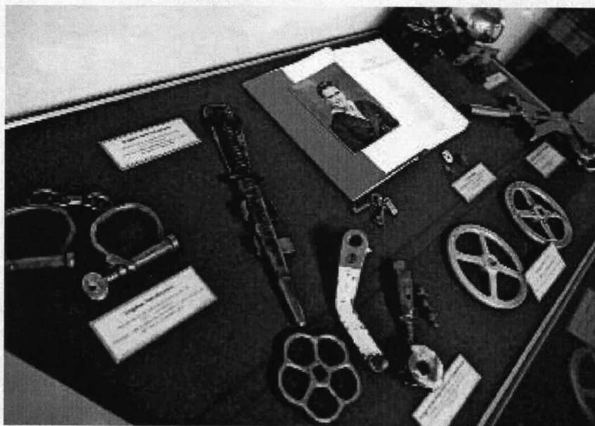
Relikwieën met elk een eigen verhaal.

Buiten het vinden van beide wrakken, heeft de commandant Onderzeedienst nog wel wat plannen voor de toekomst. 'Rust voor het personeel', geeft hij als hoogste prioriteit. 'Daar hoort bij dat ik mijn vacatures gevuld wil zien. De instroom is momenteel goed, dus ik verwacht dat het gaat lukken. Ik hoop verder dat de uitstroom van onderofficieren terugloopt. Bij de Onderzeedienst werkt over het algemeen heel goed gekwalificeerd personeel, bovengemiddeld in ieder geval. En goede lui zijn natuurlijk moeilijker vast te houden. Ik begrijp ook best dat het thuisfront door de veelvuldige afwezigheid van de heer des huizes begint op te spelen en zegt: "Nou is het mooi geweest". Gemiddeld is per jaar een bemanningslid rond de 160 dagen weg, sommigen zelfs meer. We willen dan ook het lopende jaar wat rust inbouwen, zodat er ruimte ontstaat om verlof op te nemen of functionele loopbaancursussen te volgen. Maar ook dat er meer tijd overblijft om onderhoud te plegen. Een schip moet ordentelijk zijn voorbereid op het komende vertrek. Door de drukke programma's, zoals afgelopen jaar, komt het daar niet altijd van. Een en ander houdt in dat het varen duidelijk afneemt, dat is althans mijn voornemen. Want al die re-